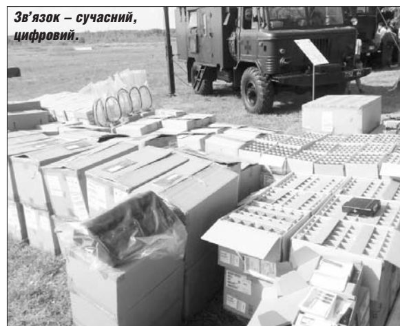
Зв'язок – сучасний, цифровий.